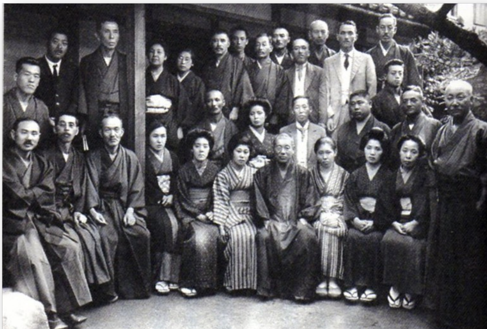
Maestro Mikao Usui y su grupo de estudiantes

El Reiki se inicia desde sus principios como una práctica grupal. Se fomenta la cooperación y la sinergia con vistas a producir un avance y un desarrollo en el individuo, pero siempre desde una perspectiva del trabajo en equipo.